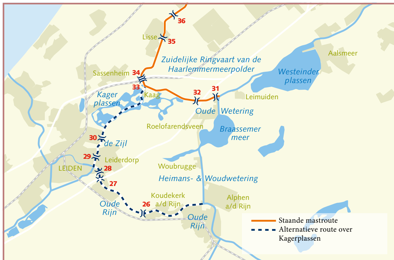
Overzicht van de alternatieve route via Kagerplassen (lus Leiden – Leiderdorp) en westelijk gedeelte van de Staande Mast Route