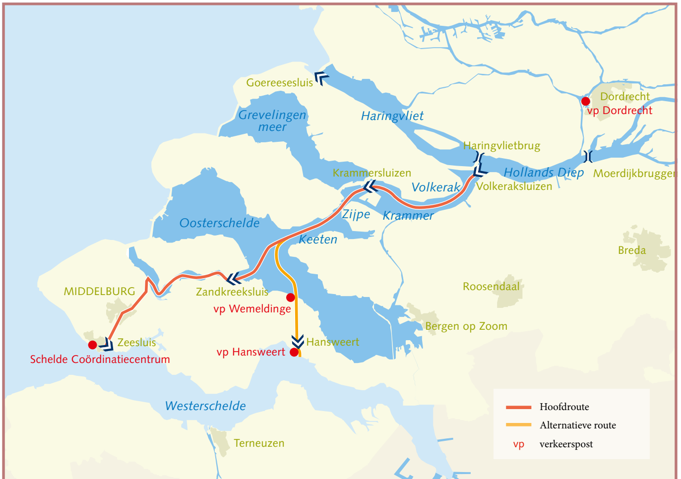
Overzicht Deltawateren Staande Mast Route