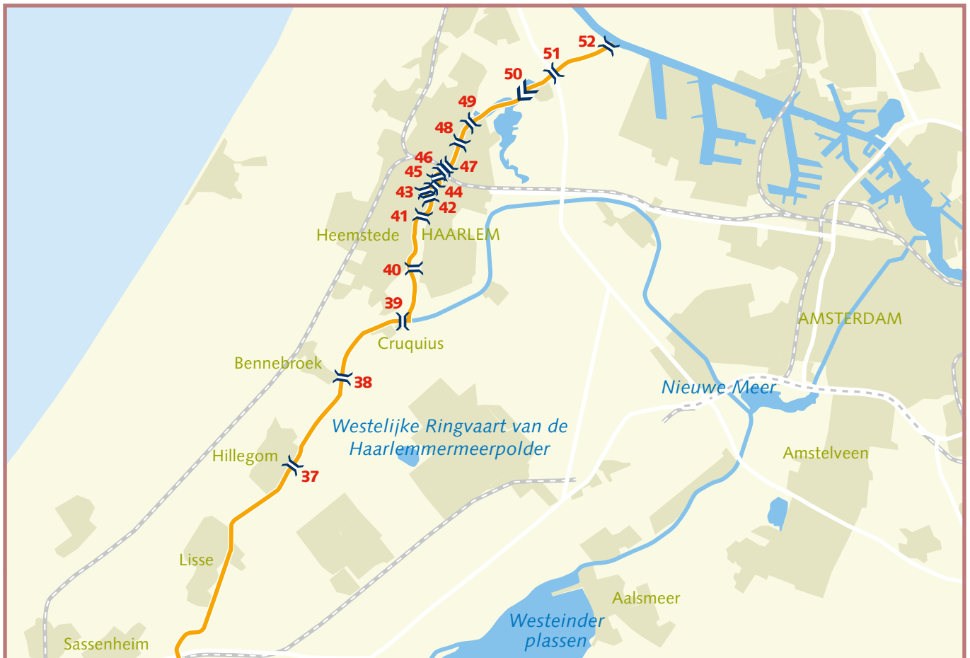
Overzicht noordelijk deel van de westelijke Staande Mast Route met doorvaart door Haarlem

Let op: voor actuele stremmingen zie teletekst pagina 721 of ga naar bladzijde 37 van deze uitgave.