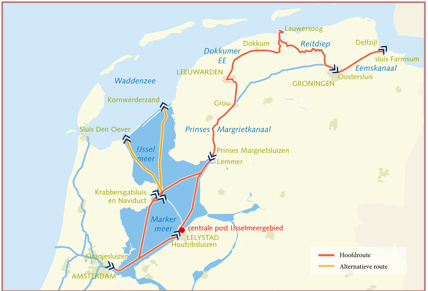
Overzicht Noord Nederland Staande Mast Route