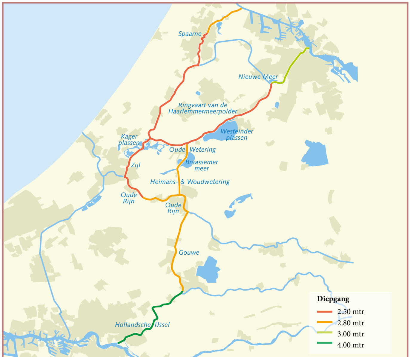
Toegestane afmetingen Grote en westelijk Staande Mast Route