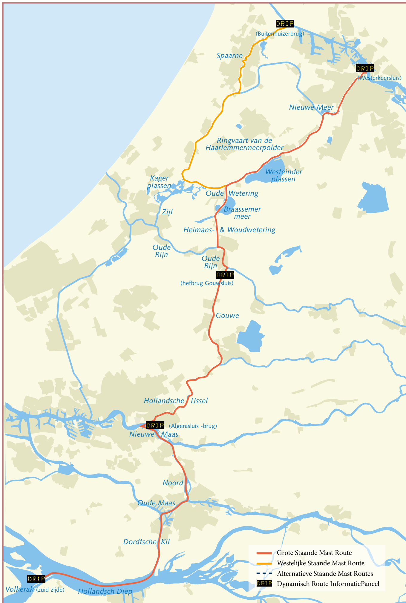
Overzicht Grote en Westelijke Staande Mast Route tussen de Volkeraksluizen en Amsterdam of Buitenhuizen en de alternatieve Staande Mast Routes