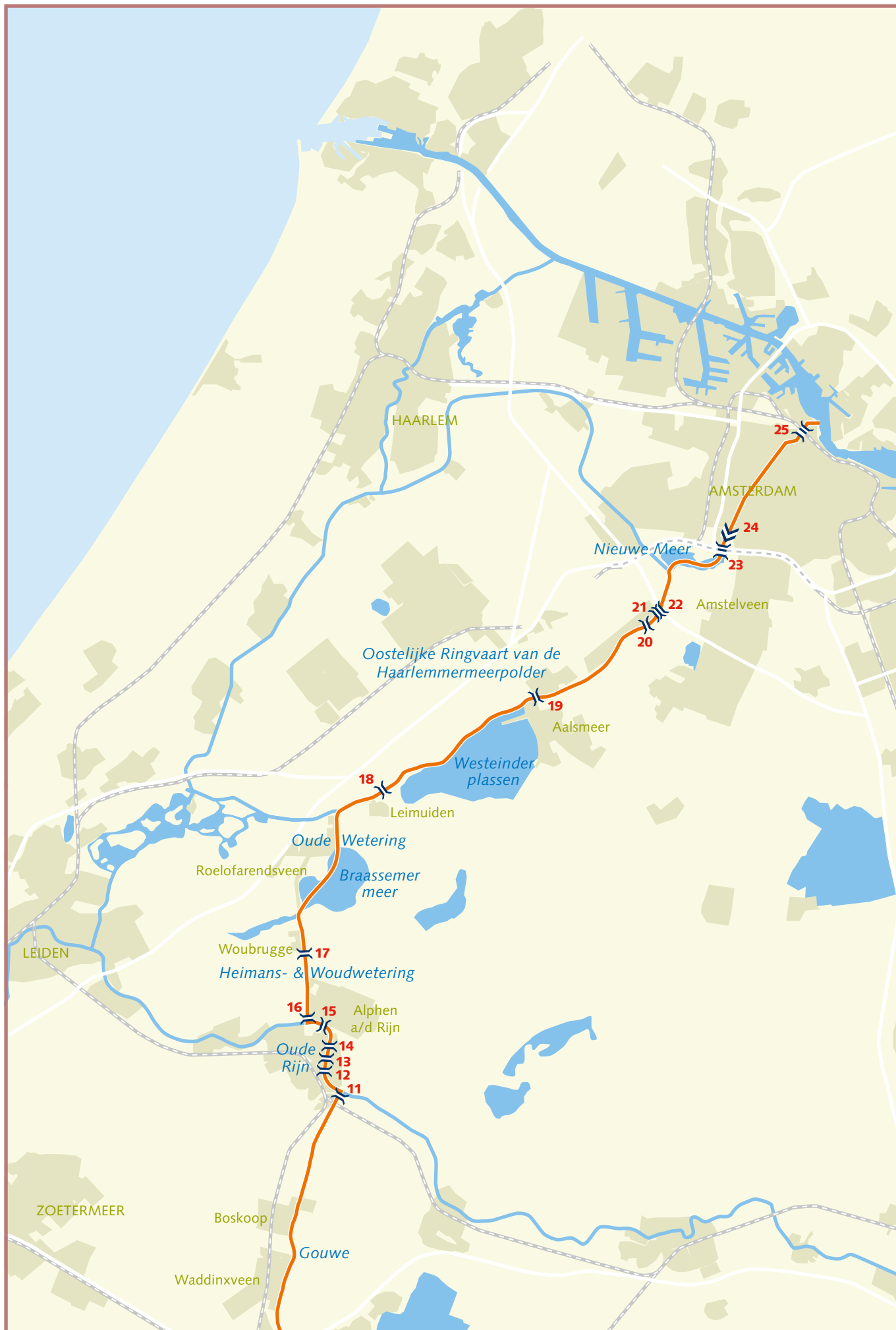
Oosterlijk deel van de Grote Staande Mast Route