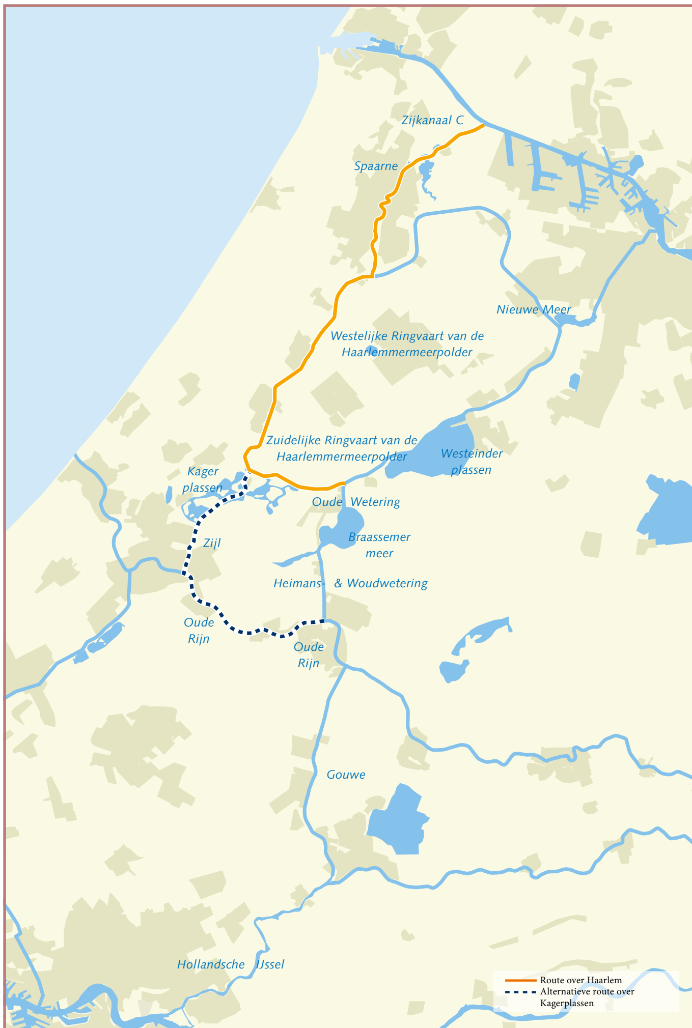
Overzicht van alternatieve route via Kagerplassen (lus Leiden – Leiderdorp) en westelijk deel van de Staande Mast Route.