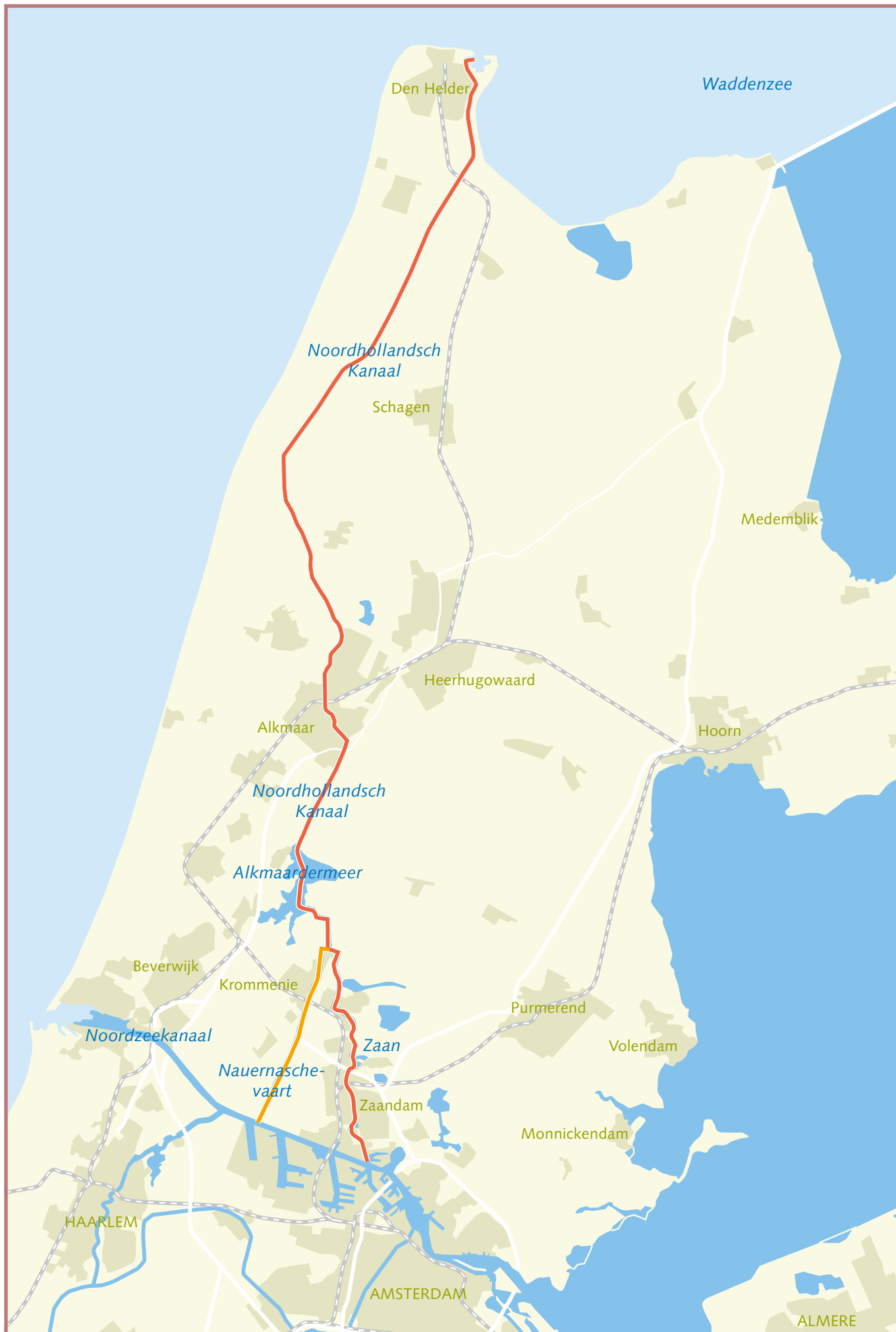
Overzicht noordelijk deel van de Alternatieve Staande Mast Route tussen Zaanstad en Den Helder