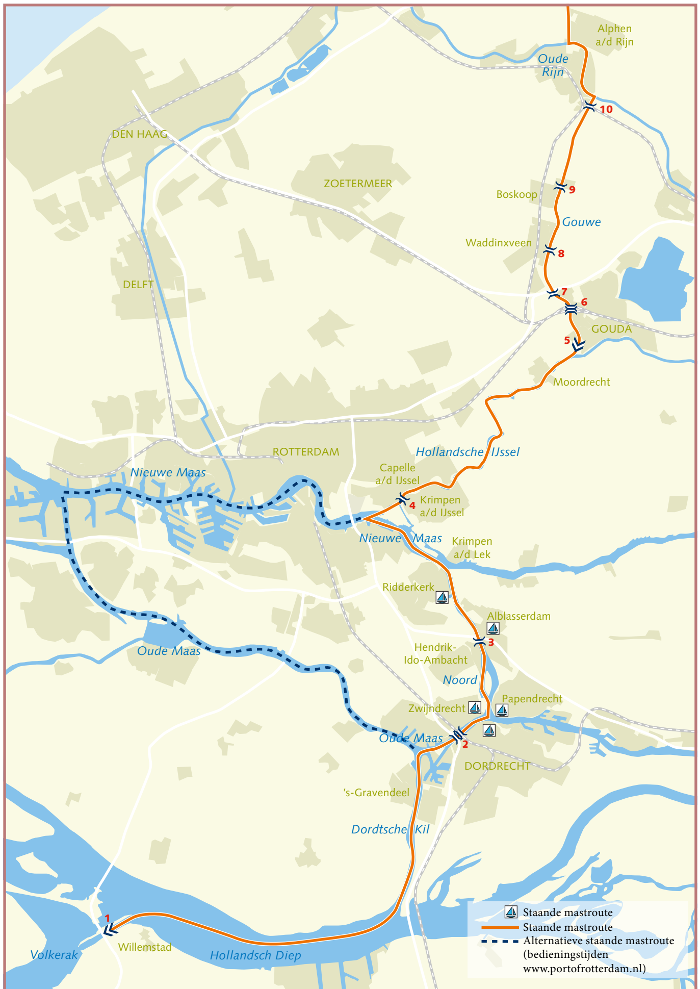
Zuidelijk deel van de Grote Staande Mast Route